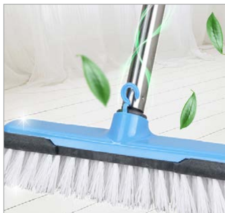
Cepillo cerdas plásticas para la limpieza de suelos