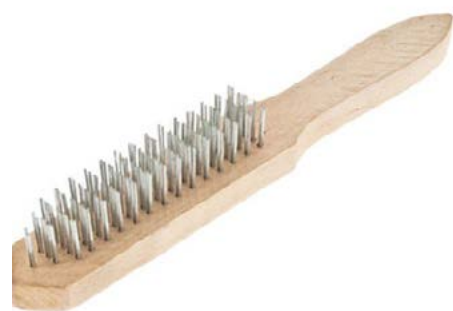
Cepillos de cerdas metálicas para eliminar arañazos