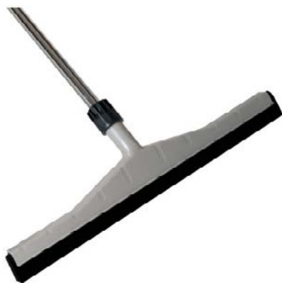
Haragán escurridor para secado de suelos